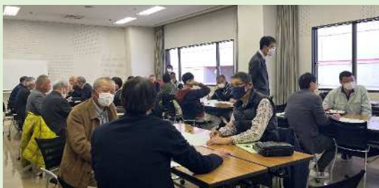
ワークショップ 「地域の悩みや楽しみを語り合おう！」