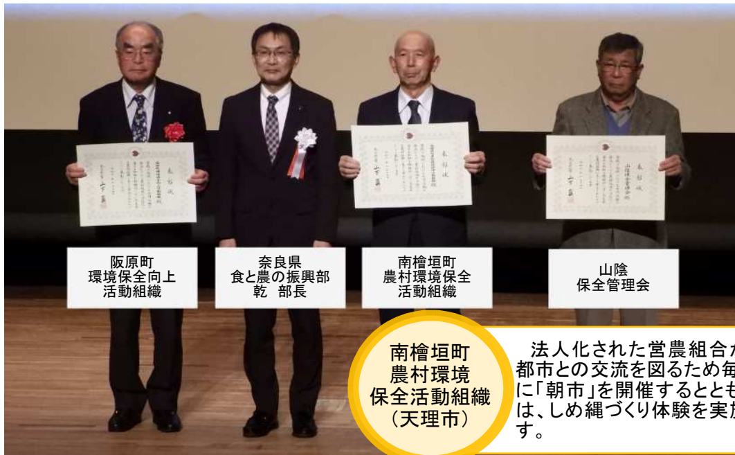
阪原町 環境保全向上 活動組織