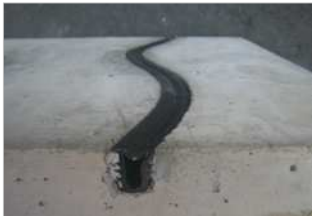
ジョイントリペア工法

水路のコンクリート表面が摩耗したり、風化したような状況や、ひび割れ、コンクリートの目地上の止水板がずれたり様々な劣化がある。放置しておく最終的に構造物として機能しなくなる。こういった劣化になってくるのかといったところから原因を突き止めてそのものにあった処置が必要。多面的支払交付金でも活用できる工法を2つ紹介。