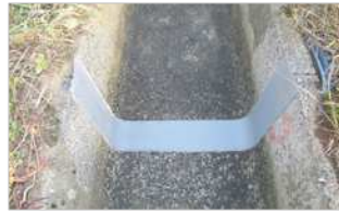
Hyperシンプルシート工法